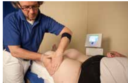
Anwendungsbeispiel: mit Tiefenoszillation intensivierte Entstauung eines Lipödems

Für Fragen und weitere Informationen über die Tiefenoszillation stehe ich Ihnen gerne zur Verfügung.